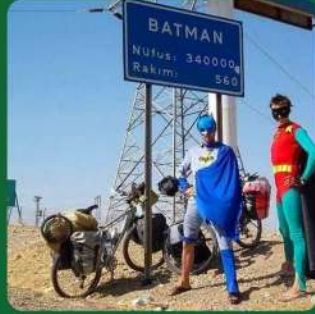
(Dergi bittiginde Editörlerin mental sağlığı)