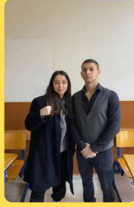
ONLAR RACON DEĞİL KAFA KESİYO!!