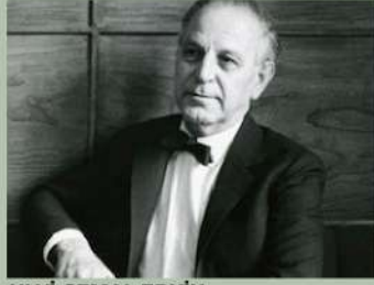
ULVİ CEMAL ERKİN

Ulvi Cemal Erkin (14 Mart 1906 - 15 Eylül 1972), Türk besteci ve eğitimcisi. Türk Beşleri arasında yer alır.