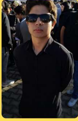
Çanakkale - Aksaray Otobüs Şöförü